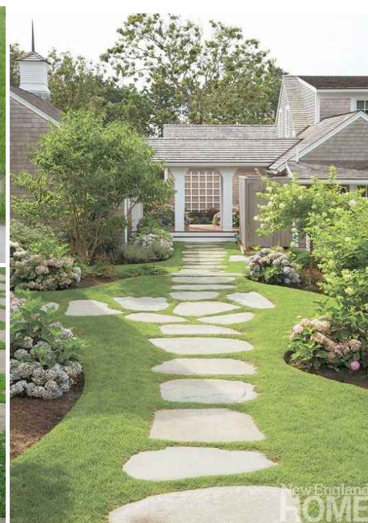
REFERENČNÍ PŘÍKLADY KAMENNÝCH ŠLAPÁKŮ petr goles Architektonická studie plochy mezi X a A